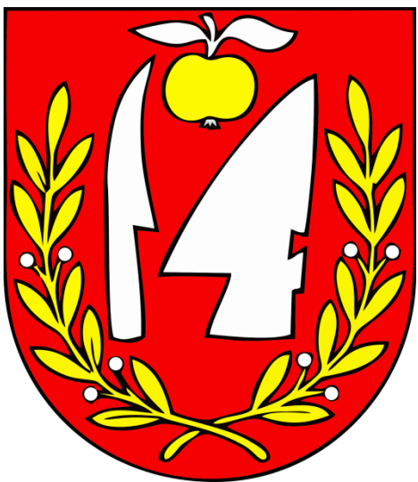
Vlajka obce Potok